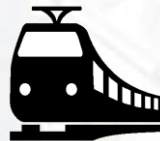
Железнодорожные пути необщего пользования