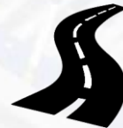
Дорожная инфраструктура (автомобильные дороги)