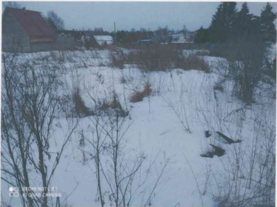
ФОТО № 1

Российская Федерация, Московская область, городской округ Лотошино, рабочий поселок Лотошино, улица Новая Слободка участок 4А (адрес земельного участка)