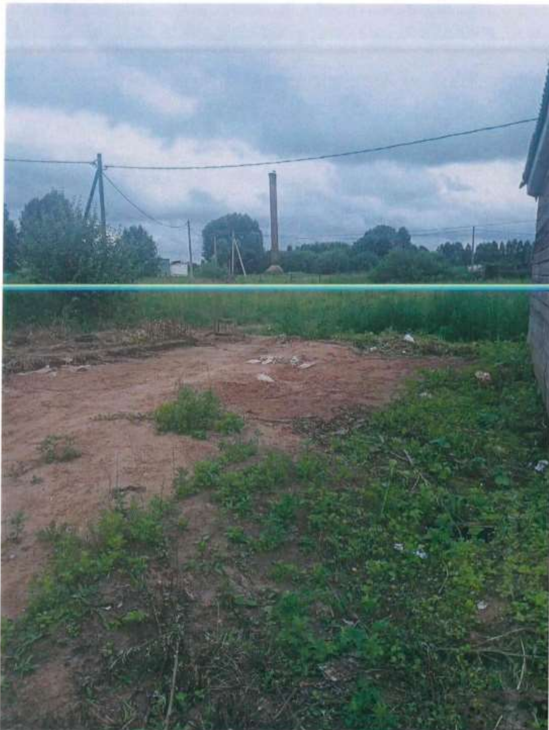
ФОТО № 3