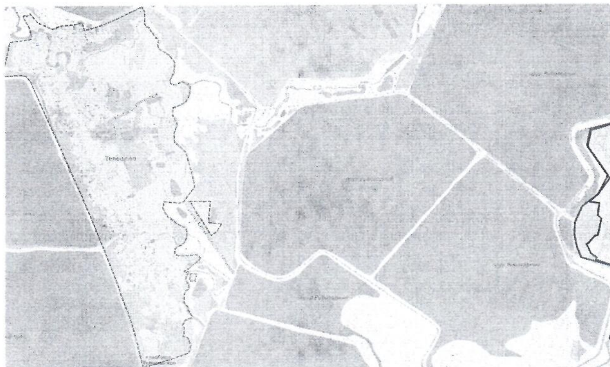
Схема расположения элемента планировочной структуры – территории, расположенной восточнее деревни Телешово городского округа Лотошино Московской области, в западной части кадастрового квартала 50:02:0020516

Приложение к постановлению администрации городского округа Лотошино Московской области от 15.09 2023 г. № 1364